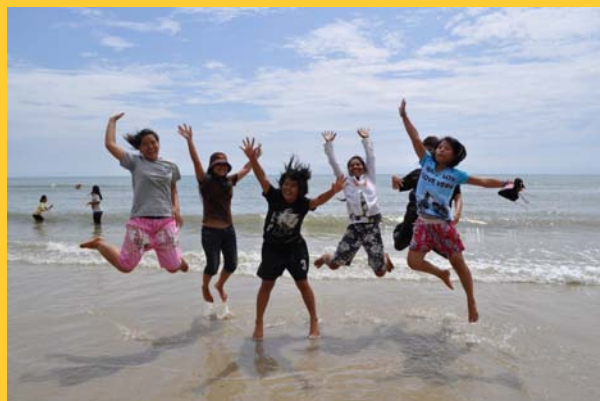
研修で海を初めて見た子どもたちは大はしゃぎ！